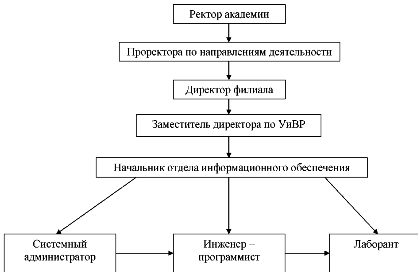
Схема организационной структуры подразделения