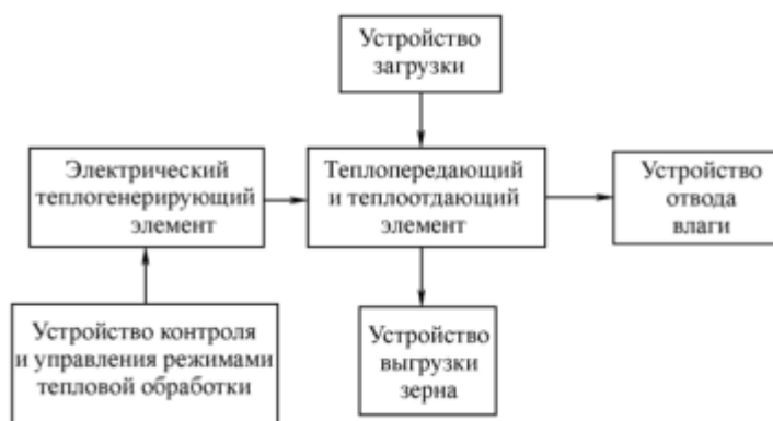
Рисунок 1 - Структурная схема контактной электроустановки для тепловой обработки зерна

Иллюстрации, при необходимости, могут иметь наименование и пояснительные данные (подрисуночный текст). Слово «Рисунок» и наименование помещают после пояснительных данных и располагают следующим образом: